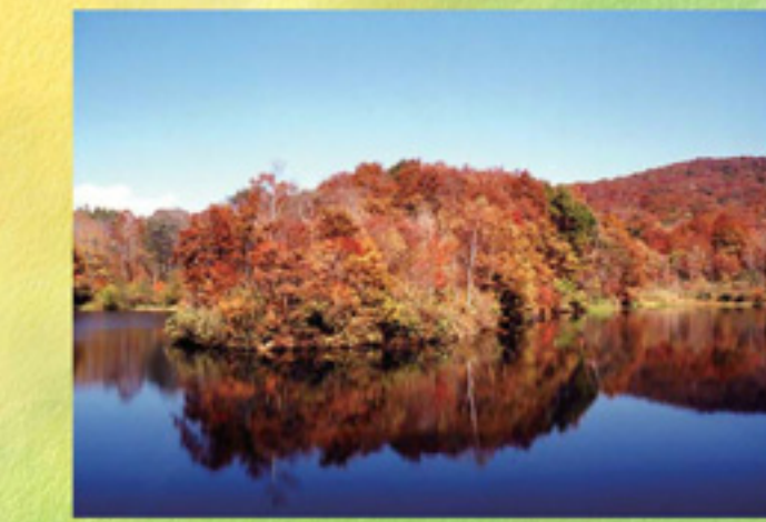
四季折々の表情を映したす「玉原湖」

玉原高原は、標高1,200~1,500mの 国有林に開かれた緑豊かな 森林リゾートです。 遊歩道では数多くの植物や 鳥・小動物にも出会えるでしょう。