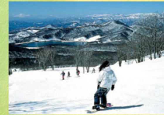
ゴールデンウィークまでスキー・ スノーボードが楽しめます。