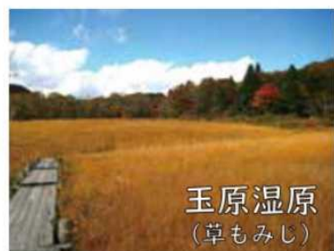
玉原湿原 (草もみじ)

お湯は昔から皮膚病に効果があると言われていいます。肌触りが柔らかくすべすべした感じの癖のない温泉です。